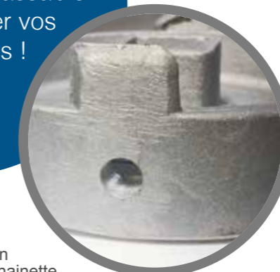
Bouchon Guillemain aluminium avec chaînette

Bouchon cadenassable pour sécuriser vos installations !